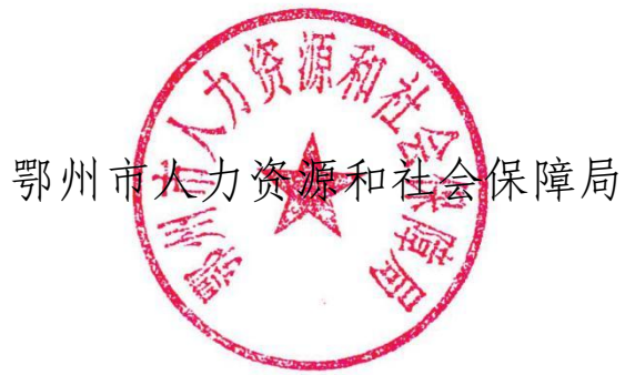
鄂州市人力资源和社会保障局