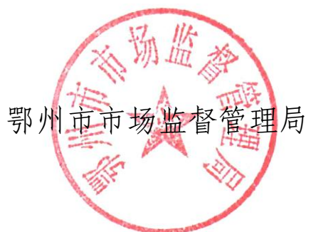
鄂州市市场监督管理局