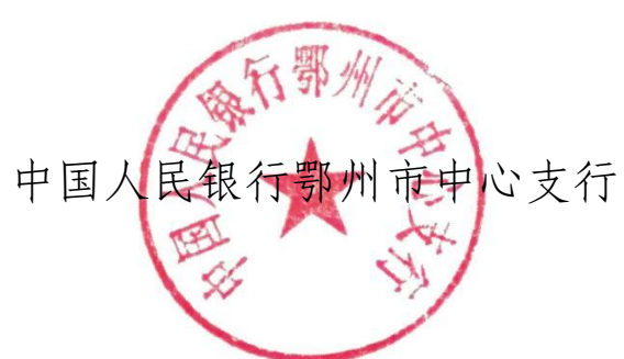
中国人民银行鄂州市中心支行