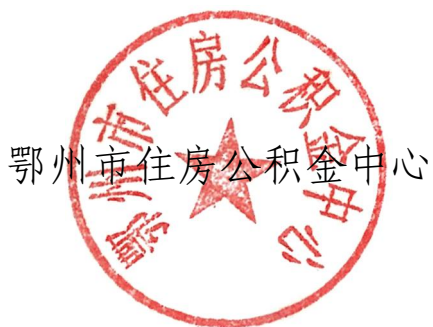
鄂州市住房公积金中心