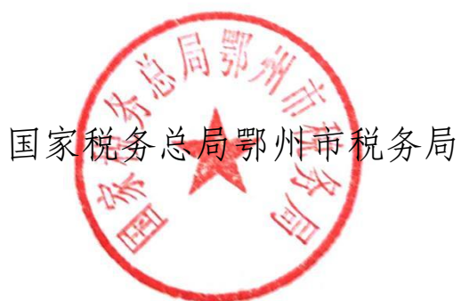
国家税务总局鄂州市税务局